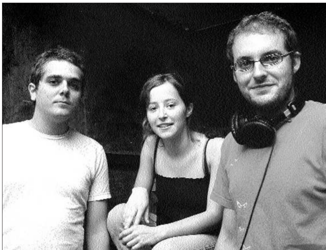
Membres del col·lectiu Ull Nu, que organitza la mostra.