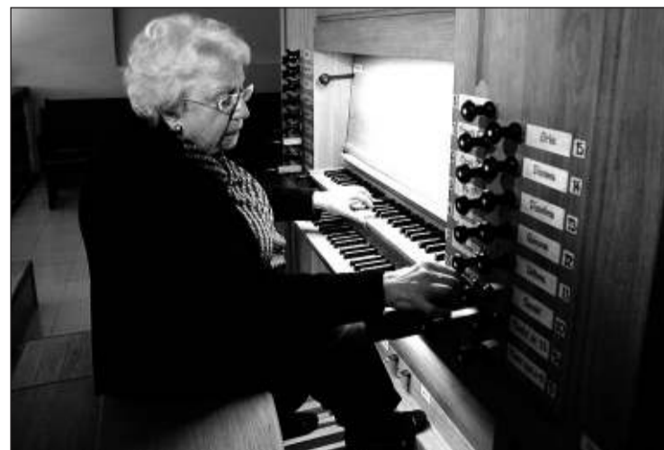
L'orgue de la Massana protagonitzarà part de les sessions.

Els promotors de la iniciativa han organitzat, així mateix, un concurs de dibuix adreçat als participants en les audicions, amb l'objectiu que els escolars