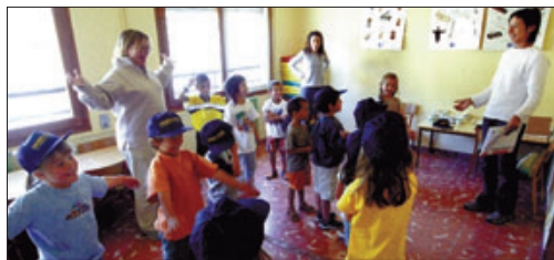
► De 4 a 6 anys ► Expressió corporal.