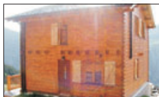
Ref 719, 165m², 3 Hab, Forn, 580,000€