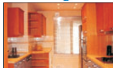
Ref 686, 90m², 2 Hab, Arinsal, 285,000€