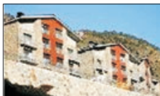
Ref 678, 62m², 2 Hab, El Tarter, 230,000€