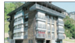
Ref 721, 872, 2 Hab, La Massana, 300,000€

ARINSAL 737 800 - CANILLO 751 900 - LA MASSANA 737 900