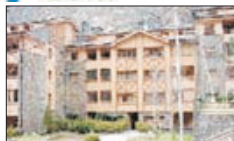
Ref 711, 87m², 3 Hab, Encamp, 315,000€